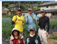
先輩移住者訪問など